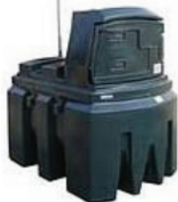
1.300 liter kunststof